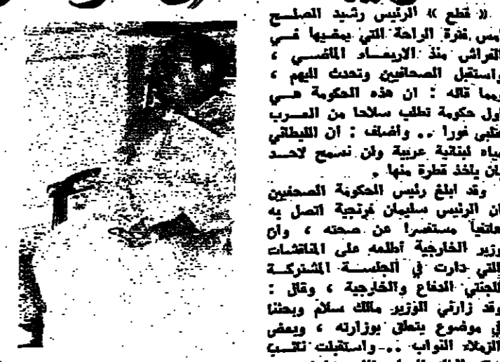
الرئيس الصلح كما ظهر في العيادة بمنزله امس

« قطع » الرئيس رشيد الصلح امس فترة الراحة التي يقضيها في الراية منذ الإرساد المتسرع، واستقبل الصحفيين وتحدث لهم.